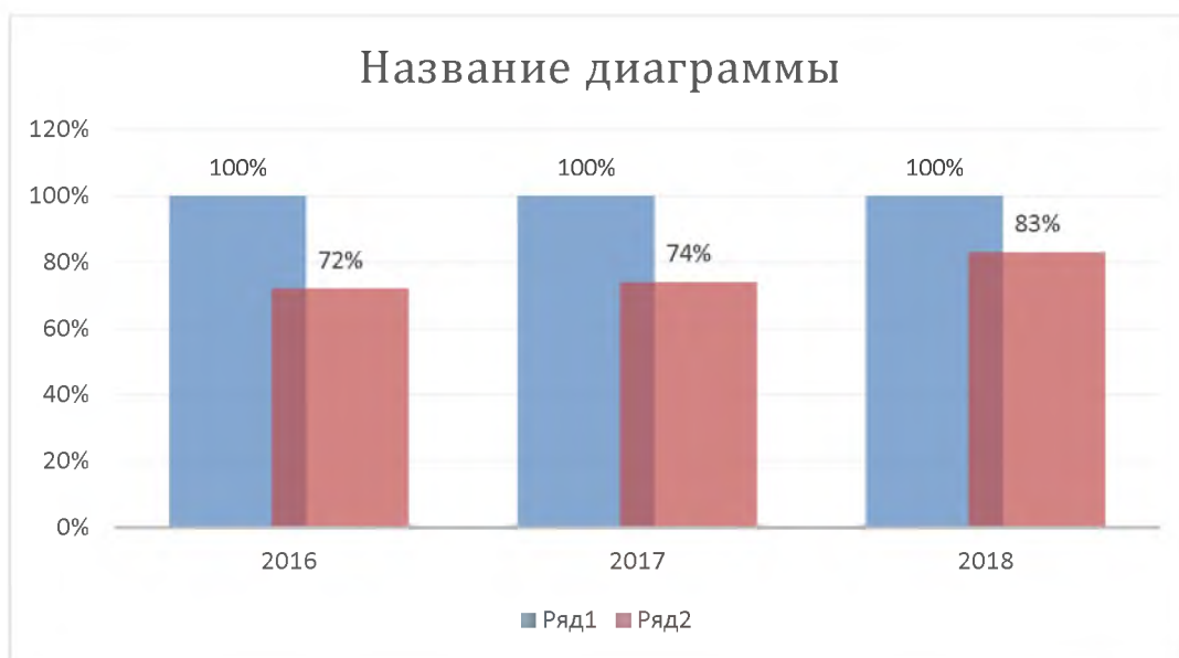
Рис. 1. Результаты качества подготовки выпускников, обучавшихся по профессиональным образовательным программам СПО за 3 последних года

3. Качество подготовки специалистов по специальностям и профессиям СПО отражены в сравнительной диаграмме за последние 3 года представлено на рис.1: