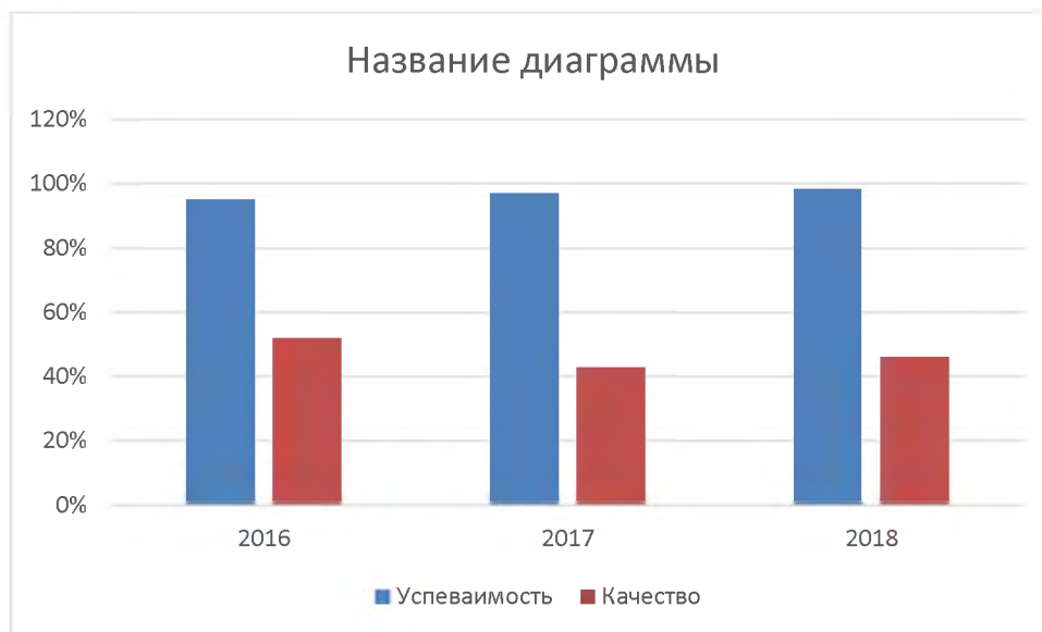
Рис.2. Динамика успеваемости и качества обученности обучающихся техникума за три последних учебных года

4. Динамика успеваемости и качества обученности обучающихся техникума за 3 года по результатам промежуточной аттестации представлена на рис.2.